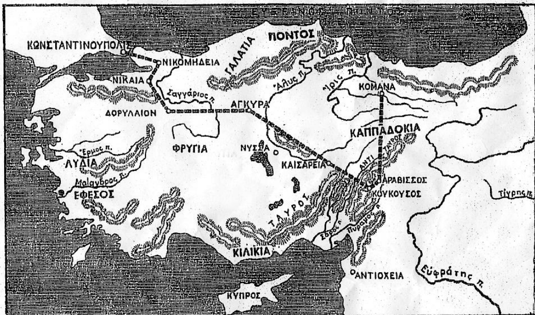
Χάρτης τῆς ἐξουρίας τοῦ ἱεροῦ Χρυσοστόμου

Νὰ ἔχουμε τὴν εὐχὴ του καὶ τὶς πρεσβεῖες του.